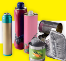
EMBALLAGES EN MÉTAL, Y COMPRIS LES CAPSULES DE CAFÉ VIDES