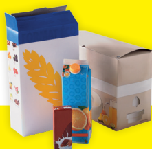
BRIQUES ET EMBALLAGES EN CARTON