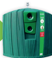
BORNE À VERRES

Si un de vos bacs (jaune ou gris) contient du verre, celui-ci ne sera pas collecté.