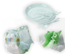
ORDURES MÉNAGÈRES DIVERSES

Le bac à couvercle gris (ou vert) doit contenir uniquement des déchets ménagers non valorisables et sont à déposer dans un sac fermé .